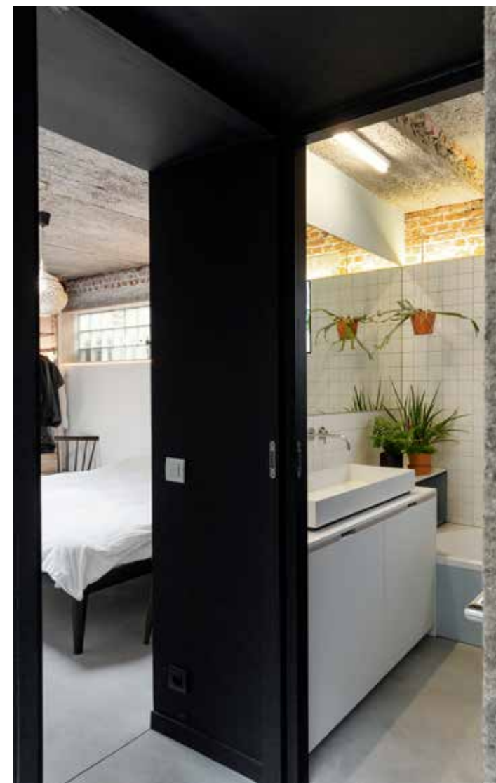
De ouderlijke slaapkamer (links) grenst aan de badkamer (rechts). De glasdallen - aangevuld met een voorzetraam in functie van de thermische isolatie - zorgen samen met de nieuwe koepels voor een vleugje daglicht centraal in de woning.