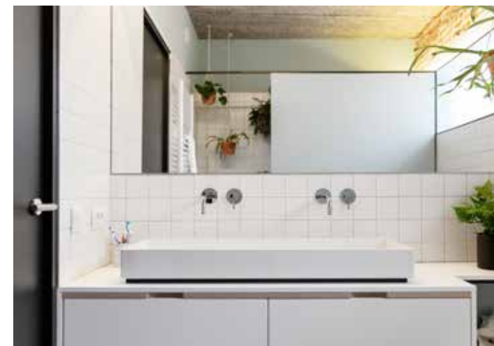
Ook in de badkamer kan een streepje groen niet ontbreken.

De zithoek, die wordt afgebakend door een stijlvolle blauwgrijze hoekbank, mondt uit in een speelhoek. Lage, op maat gemaakte Kewlox-kasten garanderen er de nodige bergruimte. In plaats van een televisie werd er een beamer geïnstalleerd, die beelden op de witte muur kan projecteren. Aan de wand die de zithoek van de ouderlijke slaapkamer scheidt, prijkt dan weer een zeldzaam kunstwerk. "Kunstenaar Steve Spruyt, de vroegere vakman die onze nieuwe koepels mee heeft gerealiseerd, heeft dat gemaakt op basis van de sgraffitotechniek (gekleurde pleisterlagen waarin een tekening wordt gegraveerd, red.). We vinden het wel fijn dat er een bijzonder 'verhaal' achter schuilt, dat bovendien samenhangt met dit project. En het past ook wel helemaal in de sfeer van onze woning", legt Jo uit. ▶