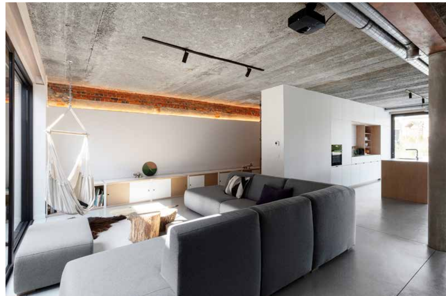
De zithoek wordt afgebakend door een stijlvolle blauwgrijze hoekbank en mondt uit in een speelhoek.

Z elfs uit de meest onverwachte situaties kan iets moois voortvloeien. Ook uit een oude, vervallen bakkerij die rijp lijkt voor de sloop. "We woonden eerst in het centrum van Aarschot en zochten een nieuwe uitdaging, waarvan we ook een deel konden verkopen om het financiële plaatje rond te krijgen", schetst architect Jo Vanden Eynde de context. "Dit pand stond al heel lang te koop en bood in het verleden plaats aan een bakkerij met een boven- en achterliggende woning. Het zag er eigenlijk echt niet uit, maar dat zijn meestal de interessantste opdrachten. Als architect kan je daar een geheel eigen twist aan geven, dus het plaatje klopte!" Jo besloot het gebouw volledig te strippen en op te splitsen in drie delen. "Het stuk waarin wij uiteindelijk onze woning hebben ingericht - het rechtergedeelte met slechts één bouwlaag - fungeerde eerst als garage, waar onder meer de zakken meel geladen en gelost werden. Op verzoek van de stad zijn we binnen het bestaande volume gebleven, waardoor het een extra uitdaging was om alle functies in te passen en er een volwaardige gezinswoning van te maken. Dat vind ik net zo leuk aan afgeleefde gebouwen: ze hebben een