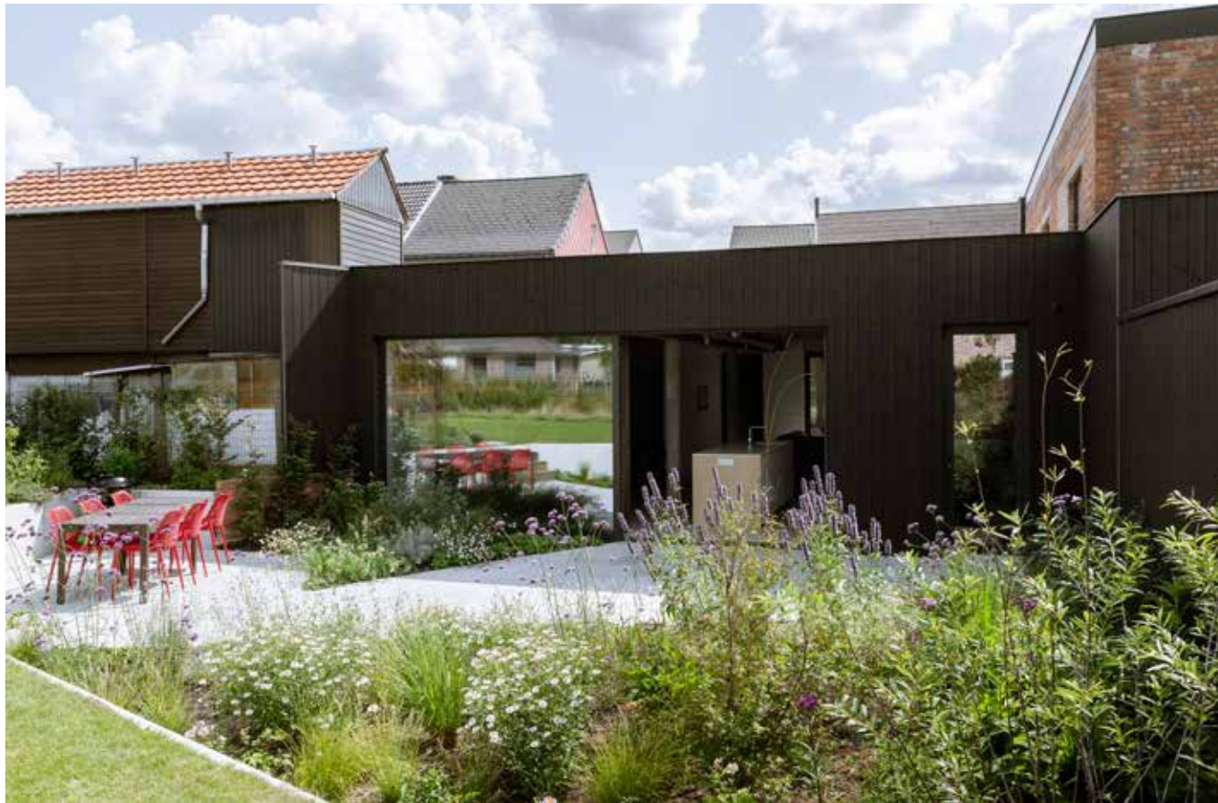
Ook het terras is uitgerust met een karaktervolle betonvloer.