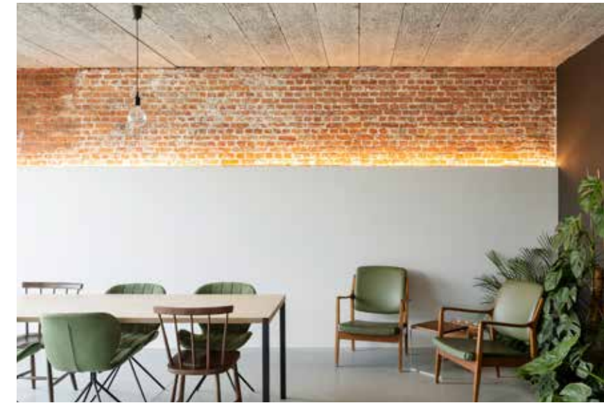
Geïntegreerde ledstrips accentueren de authentieke baksteenvlakken.