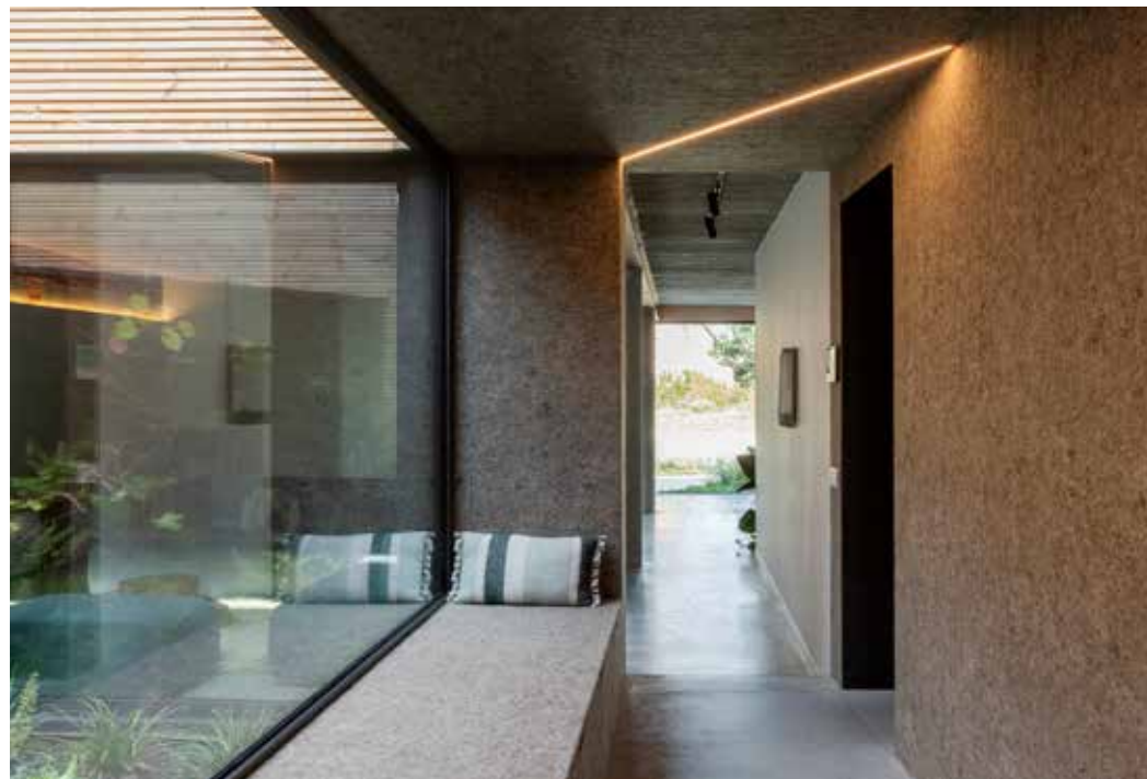
De zitbank aan de binnenpatio is uitgegroeid tot een gegeerd plekje in huis.

Industriële ruwbouwelementen zoals betonnen plafondwelsels, zichtbare baksteenvlakken en karakteristieke glasdallen zijn gecombineerd met strakke nieuwe materialen, zoals een betonvloer en witte gipswanden.