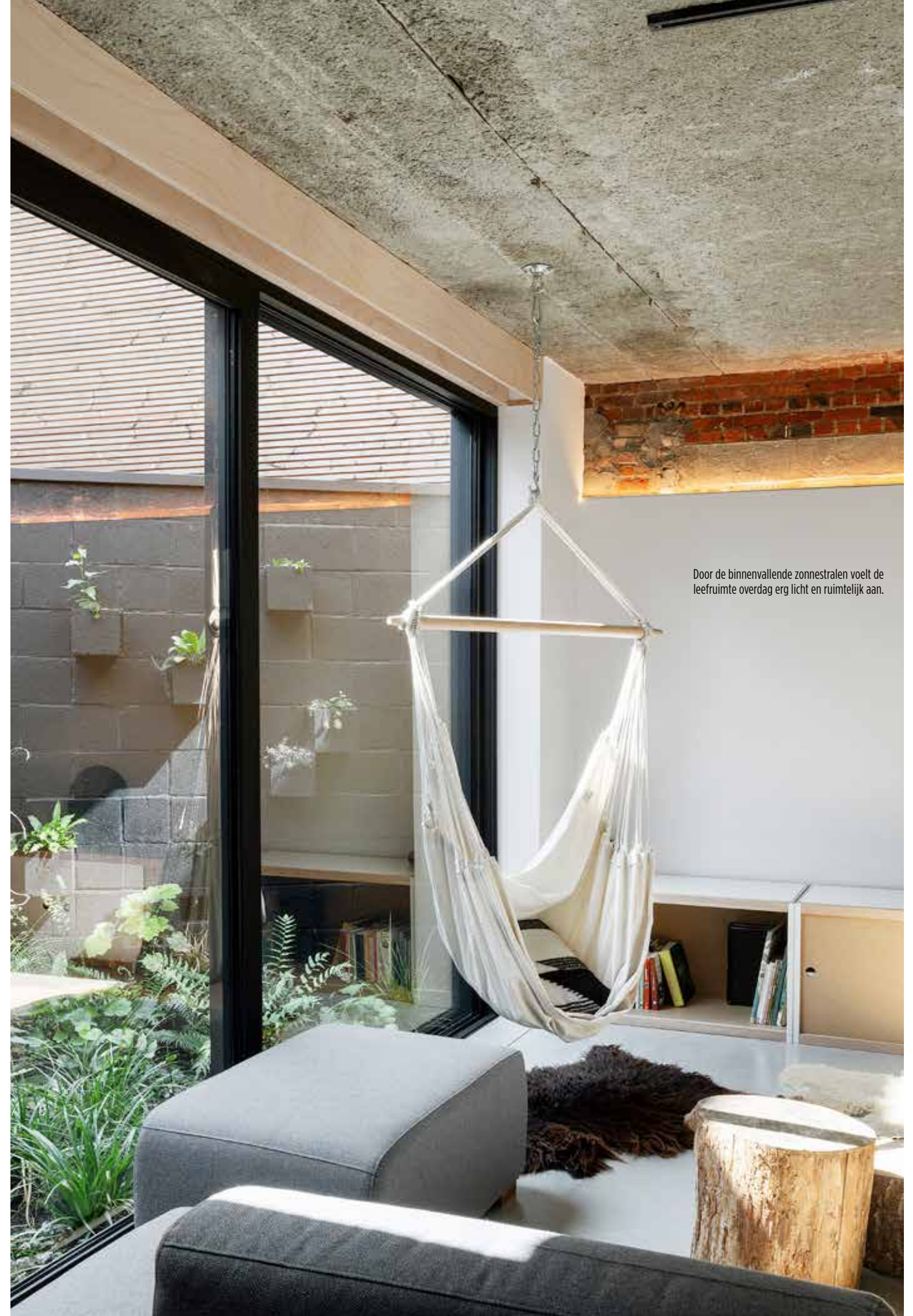
Door de binnenvallende zonnestrallen voelt de leefruimte overdag erg licht en ruimtelijk aan.

Natuurlijke lichtinval en contact met de tuin waren eveneens cruciale aandachtspunten, maar dat was in dit lange, smalle volume van 5 tot 7 meter breed en 26 meter diep allerminst een sinecure. "We moesten wel extra daglicht binnentrekken, want we wilden natuurlijk geen donker, gesloten geheel creëren", vertelt Jo. "De beglaseerde achtergevel met schuifraam was een evidentie, maar we hebben ook enkele nieuwe koepels gecreëerd in de slaapkamers en badkamer, die zich centraal in de woning bevinden. In combinatie met de bestaande glasdallen in de zijgevel zorgen die koepels voor een sereen vleugje daglicht, en dat zonder vervelende inkijk van de burens."