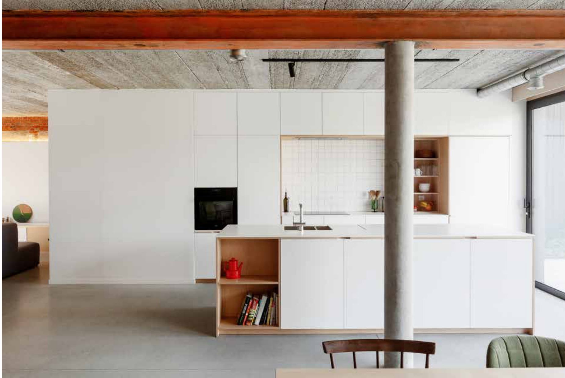
De resterende ruwbouwelementen zijn op een fraaie manier geïntegreerd in de woning. Denk bijvoorbeeld aan de betonnen steunkolommen, de karakteristieke oranje-rode steunbalk die de volledige leefruimte bestrijkt en de betonwelfsels die als plafond fungeren.

erg aangenaam zitten is. Het is zelfs uitgegroeid tot een gegeerd plekje in huis, waar we ons indien nodig even in alle rust kunnen terugtrekken. De horizontale triple thermowoodbekleding op de overige wanden rond de patio versterkt het warme, natuurlijke gevoel."