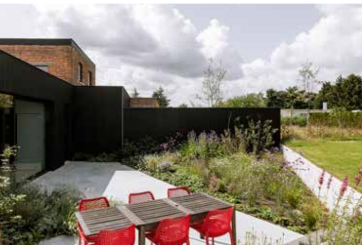
In het beton zijn strategisch gepositioneerde uitsnijdingen gemaakt voor struiken en bloemenperken, zodat de bewoners zowel binnen als buiten zicht hebben op kleurrijk groen.

De open keuken met bijpassend kookeiland, achterliggende berging en aanpalende eetruimte bevindt zich aan de achterzijde van de woning. Via een zwart aluminium schuifraam loopt die naadloos over in het terras, dat eveneens met een karaktervolle betonvloer is uitgerust, en de hoger gelegen tuin. "We hebben de vloer nog een stuk uitgegraven om extra plafondhoogte te creëren. Ook dat maakt een groot verschil voor de woonbeleving. En in het betonnen terras hebben we strategisch gepositioneerde uitsnijdingen gemaakt voor struiken en bloemenperken, zodat we vanuit onze woning zicht hebben op kleurrijk groen. Dat alles maakt dat we zeer tevreden zijn met het resultaat. Aanvankelijk hadden we onze twijfels bij gelijkvloers wonen, maar we waren al snel overtuigd. Elke vierkante centimeter ruimte wordt benut. Intussen weten we dat dit niet onze eindbestemming zal zijn (op termijn zullen Jo en haar gezin verhuizen naar een cohousingproject in de bossen van Langdorp, dat ze volop aan het ontwerpen is, red.), maar momenteel is dit perfect. Een optimale verzoening tussen industriële charme, rust en natuur", besluit Jo. ■